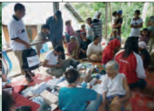
AWO International unterstützte die Partnerorganisation IBU Foundation unter anderem bei der Verteilung medizinischer Hilfsgüter und der Einrichtung mobiler Kliniken für Verletzte.