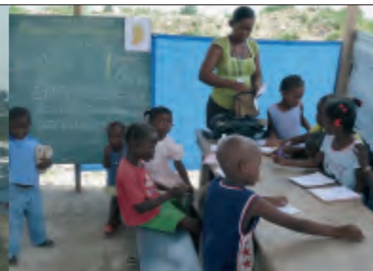
AWO International unterstützt den Partner CSDI vor allem beim Aufbau und Betrieb von Kinderschutzzentren in den Notlagern. Dort haben die von der Katastrophe oft schwer traumatisierten Kinder die Möglichkeit zum Lernen und Spielen.