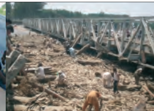
Im Sommer 2010 hat die Jahrhundertflut in Pakistan ein Drittel des Landes überschwemmt, zahlreiche Häuser und große Teile der Infrastruktur zerstört, wie hier eine Brücke in Agra (Distrikt Charsadda). Von der Katastrophe sind 20 Millionen Menschen betroffen.