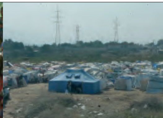
Croix-des-Bouquets, Haiti: In den Notlagern leben 16.000 Menschen, die durch das Erdbeben im Januar 2010 obdachlos geworden sind. Das Centre de Santé et Développement Intégré (CSDI), Partner von AWO International, betreibt hier eine Zeltklinik.