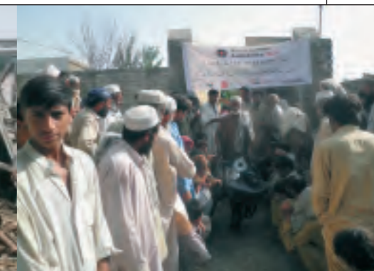
AWO International unterstützt den Einsatz des Schweizerischen Arbeiterhilfswerks (SAH) im Nordwesten Pakistans. Dort haben 1.450 Familien Werkzeug und Schubkarren erhalten, um nach dem Zurückweichen des Wassers ihre von Schlamm bedeckten Häuser ausgraben bzw. Notunterkünfte bauen zu können.